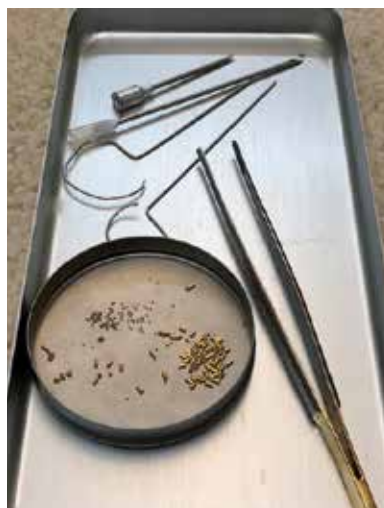
De benodigdheden voor het doen van goudkorrel acupunctuur: goud, pincet, mandrijn en naalden.

Als alle gewrichten zijn behandeld kunnen er nog röntgenfoto's worden gemaakt ter bevestiging van de juiste locatie van de goudkorrels. Vervolgens wordt uw huisdier weer wakker gemaakt en kan hij vaak binnen dertig minuten weer naar huis.