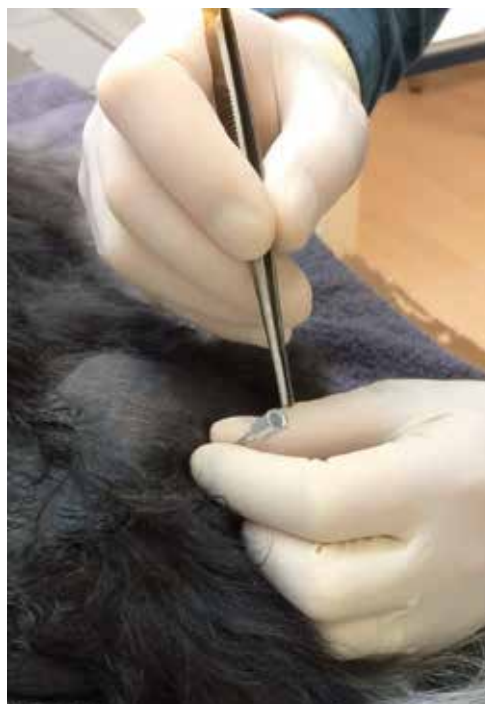
Hier wordt een goudkorrel in een naald gebracht. De punt van de naald zit precies in het acupunctuurpunt. Middels een mandrijn wordt de goudkorrel in dat acupunctuurpunt geduwd en wordt de naald vervolgens verwijderd.